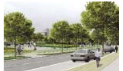
Resim 2: Wesseling Merkezi, yarışma teklifi, 1. Ödül – trafik yolunun kaldırılması rha reicher haase mimarlık + şehir planlama, Aachen