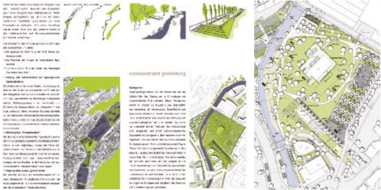
Resim 3: Gevelsberg Ennepe parki, yarışma teklifi, rha reicher haase mimarlık + şehir planlama, Aachen lad - Landschaftsplanung Diekmann, Hannover

Bu olgu kent planlaması için şu anlama gelir: kırsal alanlar şehirlerin bir parçası olarak algılanmalı – kentlerin çevresindeki kırsal alanları kentin bütünleyeni olarak görmek, geçmişe ait ve terk edilmesi gereken bir tutum olarak görünmektedir. Tabii kırsal çevrenin rolü durumdan duruma değişmektedir. Şehir merkezlerindeki