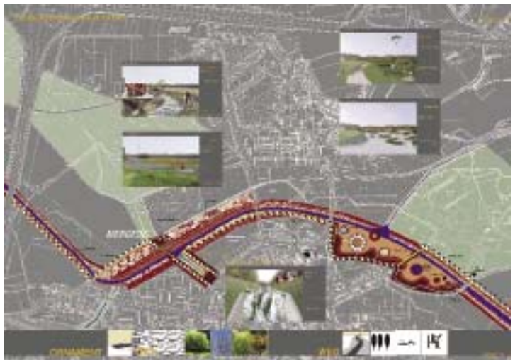
Resim 4: Emscher'in geleceği, uluslararası yarışma teklifi, rha reicher haase mimarlık + şehir planlama, Aachen lad - Landschaftsplanung Diekmann, Hannover