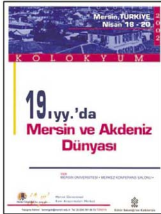
18-20 Nisan 2002 tarihinde gerçekleştirilen ilk kolokyum