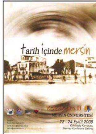
22-24 Eylül 2005 tarihinde gerçekleştirilen ikinci kolokyum