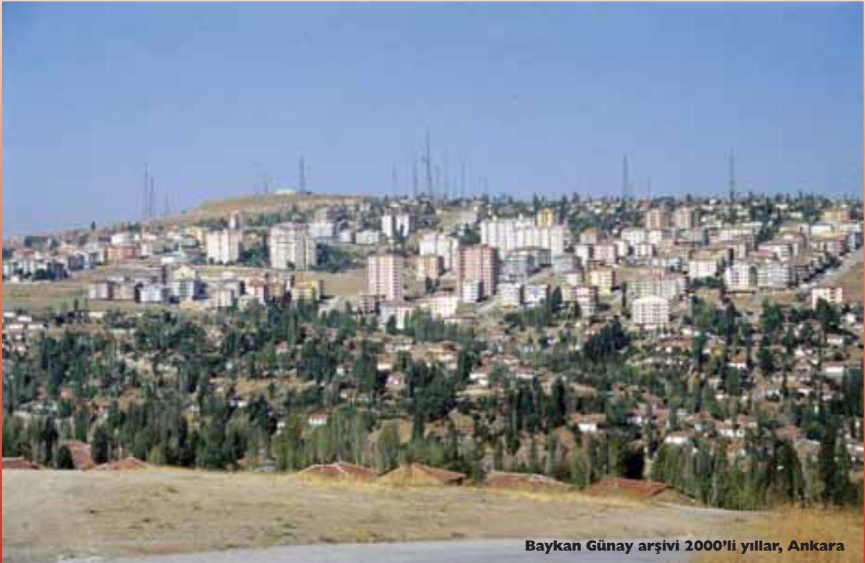
Baykan Günay arşivi 2000'li yıllar, Ankara

TMMOB Şehir Plancıları Odası Yönetim Kurulu