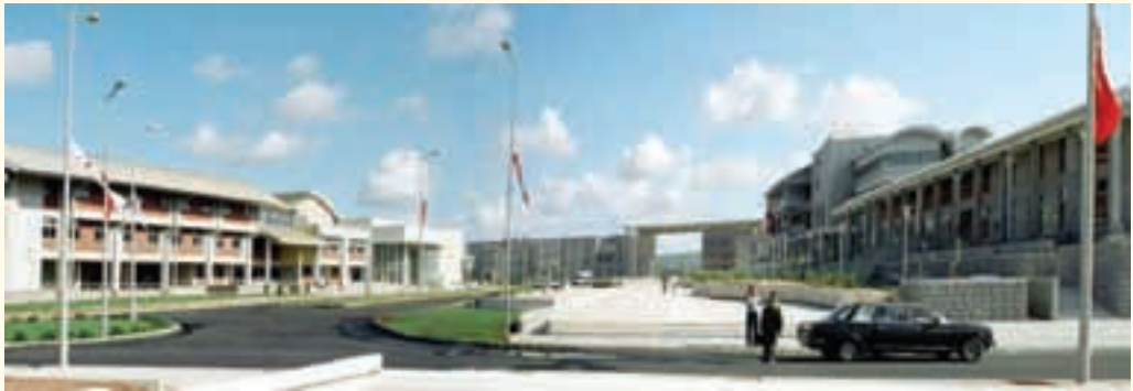
ODTÜ Kuzey Kıbrıs yerleşkesi meydanı