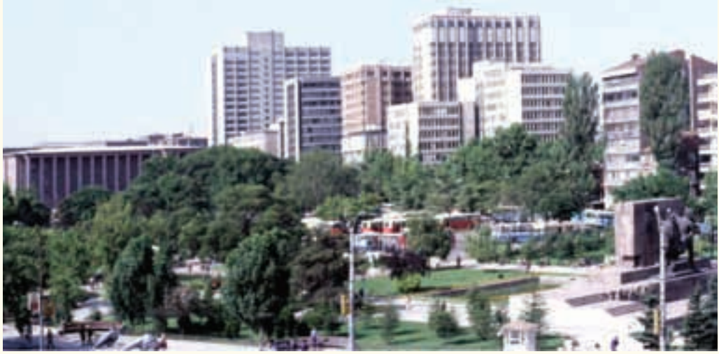
Ankara Güven Park çeperi

ODTÜ Kuzey Kıbrıs Yerleşkesi Meydanı: Kimi zaman da, özellikle mülkiyet açısından bir sorun yaşanmadığında, morfolojik yapı ile mimarlık ve peyzaj bütünleştirilebilmekte, farklı mimarlar yönlendirilerek başarılı çevreler üretilebilmektedir.