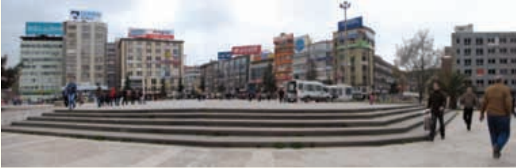
Samsun Cumhuriyet meydanı

İzmir Kordonu: Morfolojik olarak aynı saçak yüksekliğine sahip basit bir çizgiden oluşmaktadır; zenginliği yaratan renkler, panjurlar ve tek tek birimlerin ölçüsünden kaynaklanan ortak mimarlıktır.