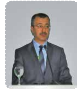
Sebahattin DÖKMECİ Çevre ve Şehircilik Bakanlığı Çevre Yönetimi Genel Müdür Yardımcısı