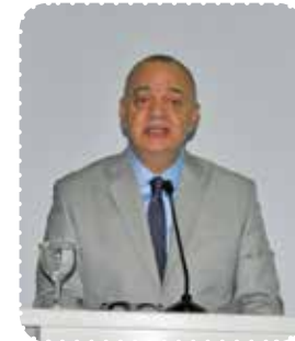
Cengiz ERGÜN Manisa Büyükşehir Belediye Başkanı