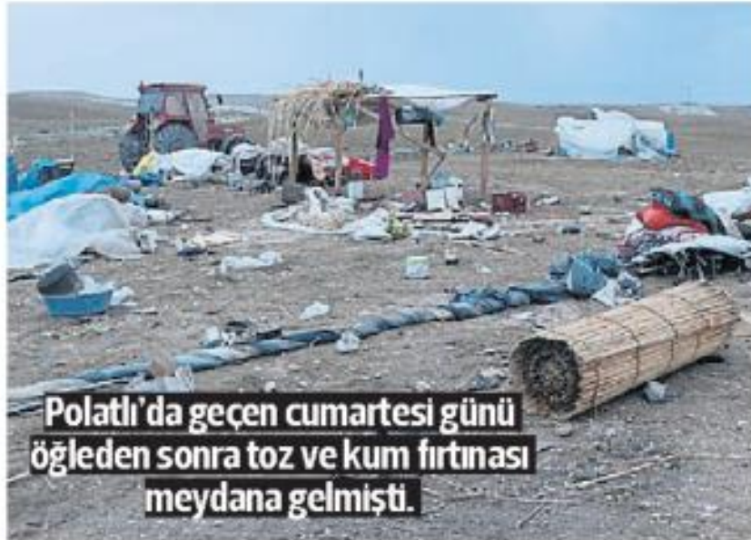
Polatlı'da geçen cumartesi günü öğleden sonra toz ve kum fırtınası meydana gelmişti.

doğa ve insan faaliyetlerinden kaynaklı risklerin tespit edilerek önlenmesi için gerekli analizler oluşturulmalı, risk yönetiminin ilk aşaması olan planlama