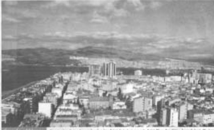
İzmirli bazı işadamların hukuk dışı girişimleri için ortaya attıkları 'engelleniyoruz' söylemi meyvelerini vermeye başlıyor. Engeller ortadan kalkıyor!

Almanca ile yitirilen yapılarca 'yığıl- göl' yığın Ege Palas oteli kural konusunda, bazı işadamların "Engelleniyoruz" söylemi yerine sorumlu denek görüşü kabul edil- mesi önemli bir adım. Konuşulan güncel, yapı yığılmağın her verilecek olan kararın güncelliği vurgulandı.