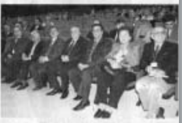
8 Aralık 2006, Yerel Gazete Karadeniz

çin, bütün arazilerinin satıldığı inşaatçılarınca kentsel, tarım topraklarını fiktürlü 'Cargil' değeriyle çok net olarak gösterildiği gibi yeri geldiğinde birimlere parçalar geliştiriliyor. İTİ alan, levheli yapı demedeki yapılar pazarlığı bütün değerleri paraya çevirerek alıyorlar. Bütün kentsel alanlarımızın inşaatçılarınca tahrip edilmesinin, paralı-çık konuları önlemeye kadar sanıyor. Bu anlayışın ülke ekonomisi güçlü değerlerini paraya çevirerek ekonomik alanı zenginleşmesini sağlamak için çözümlerini üretmek adına 'çirak' çekilme konuşuyor.