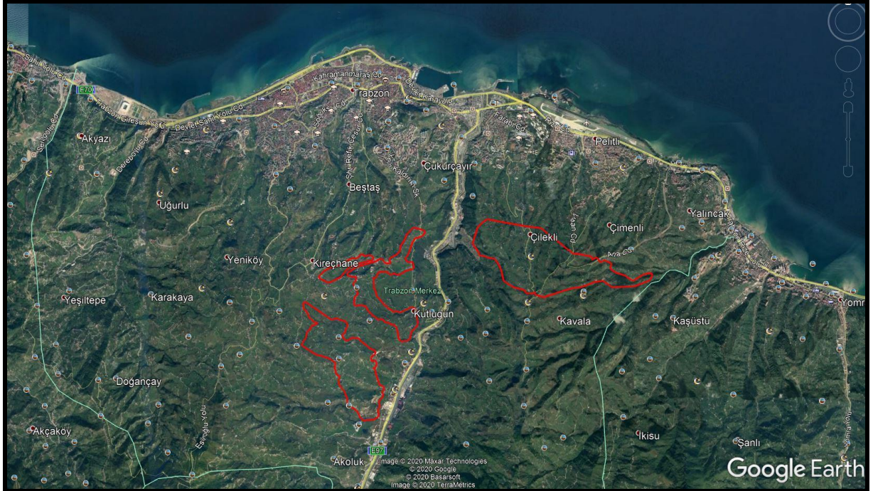
Şekil 1: Plan değişikliğine konu alanın konumu

Plan değişikliğine konu alan; Trabzon İli, Ortahisar İlçesi sınırlarında Yalıncağ-Çilekli-Çimenli bölgesi ile Kanuni Bulvarı çevresinde yer alan Kutlugün-Gölçayır-Düzyurt-Gözalın-Çukurçayır bölgesidir.