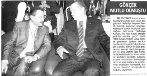
GÖKÇEK MUTLU OLMUŞTU

BELEDİYELER Kanunu'nun hazırlanmasında payı olan Büyükşehir Belediye Başkanı Melih Gökçek, kanunun onaylanmasından büyük mutluluk duyduğunu belirterek, "Belediye Kanunu ile hep hayal ettiğim yerleri elimize geçirdi" dedi. "Hep hayal ettiğim, ama elimize geçmeyen yerleri bu kanunla elimize geçirdi" diye konuşan Gökçek, kanun ile yapılabilecek, karnel dönüştürme projeleri ve ana üretimi gibi konularda belediyelerin eline yerleri geçirdiğini kaydetti. Gökçek, hazine arazılarının belediyeye devri ve ana üretimi ile gelirin artacağını belirterek, kanunun "devrim" niteliğinde olduğunu söyledi.