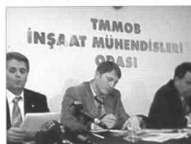
TMMOB İNŞAAT MÜHENDİSLERİ ODASI

Türktaş, bizzat Büyükşehir Belediye Başkanı Melih Gökçek'in bu tablonun yaşanmasına ön ayak olduğunu kaydederek, Gökçek'in "Sincan'dan Kızılay'a 15-20 dakikada ulaşabileliyoruz" sözleriyle insanların hız limitlerini aşmasını bizzat desteklediğini ifade etti. İstanbul Yolu'nun bazı kesimlerinde sabah ve akşam saatlerinde saat başına 300 kişinin karışık karayolu geçme talebinin olduğunu belirtti.