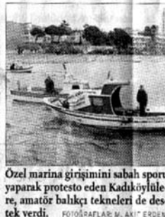
Özel marina girişimini sabah sporu yaparak protesto eden Kadıköylülere, amatör balıkçı tekneleri de destek verdi.