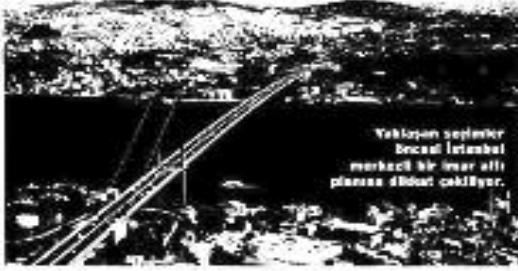
Yaklaşan seçimler öncesi İstanbul merkezli bir imar affı planına dönme bekleniyor.

Seçimler yaklaşırken, AKP'nin yeni bir imar affına hazırlandığı dile getiriliyor. Ülkeyi 50 yıl geriye götüreceği ifade edilen bu affa kaçak yapılaşmanın hızlanması bekleniyor