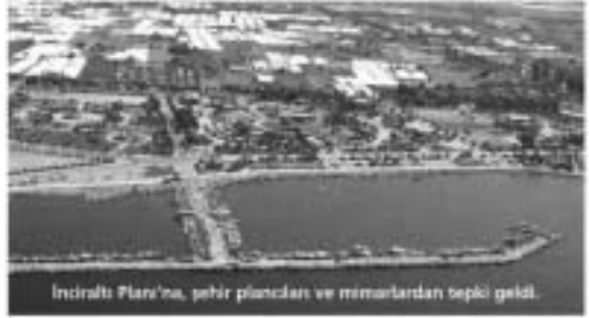
İnciraltı Planı'na, şehir plancıları ve mimarlardan tepki geldi.

İzmir'de Alibeyköy-Toran arasında hayata geçirilmek istenen Yeni Kent Merkezi projesinin imar planlarıyla ilgili yargılan "yetersizliği" kararı çıkararak, İnciraltı bölgesi için hazırlanan planlar da yargıya taşınıyor. Kültür ve Turizm Bakanlığı tarafından 1/25 bin ölçekli koruma amaçlı çevre düzeni planı yapılıp ve projelendirme aşamada Kültür ve Turizm Bakanlığı Koruma Kanunu'ndan ortaya alan İnciraltı Planı'na dava yolu görüldü. Bakanlık tarafından yapılan plan yetersiz bulundu kararı çıkan Şehir Plancıları Odası ile Mimarlar Odası ortak dava açmaya hazırlanıyor. Önemli konularla ilgili bir açıklama yapı-