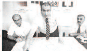
Nazım İmar planı üzerinde 1800 metrelik katlı yol projesinin yapılacağı alanı göstererek, Tüfek, "Katlı yol bu bölgede değil, Belediye'leri kavşağından sonraki 'Samsun-Trabzon' karayolunun birleştiği alana yapılmalı" dedi.

'En kısa sürede doğru çevre yolu planlanmalı' 1986 yılında yapılan Nazım İmar planında olduğu gibi, Belediye'leri ile 100. Yıl Bulvarı çevre yolu kavşağının