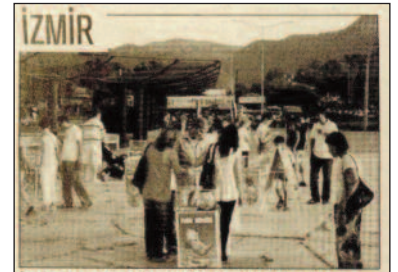
İnciraltı projesi İzmir'in tepkisini çekiyor.

* 19.07.2010 – REFERANS – "Mevcut Planlar İnciraltı Sorununa Çözüm Getirmez"