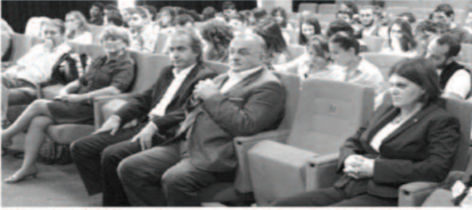
Dokuz Eylül Üniversitesi öğrencileri ve akademisyenleri önemli bir brifinge katıldı.