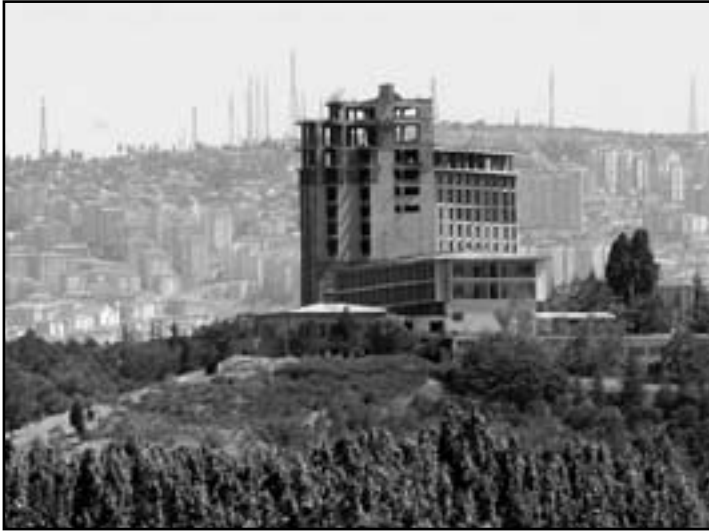
Resim 3. Marmara Oteli, 2004.