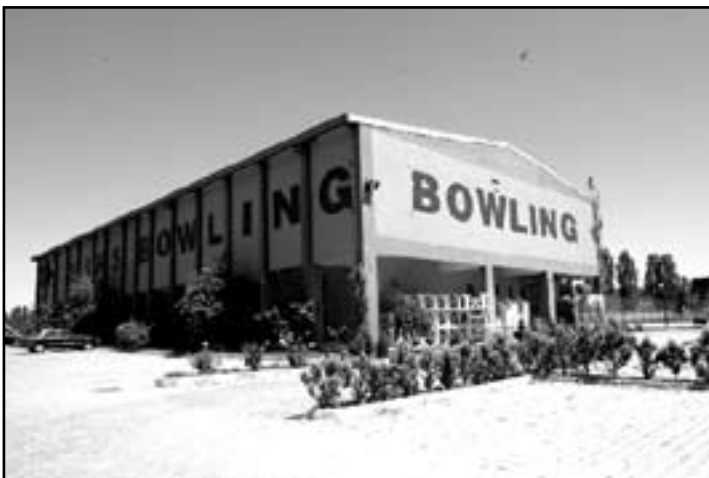
Resim 4. Bowling Salonu, 2004.

Kiralanan arazilerden örnekler