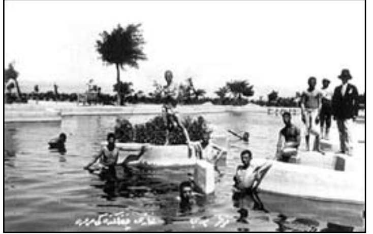
Resim 2. Marmara Havuzu

Kuruluş amaçları doğrultusunda, Atatürk Orman Çiftliğinde ilk aşamada ziraat ve hayvancılık organize edilmiştir. Bunun uzantısı olarak endüstriyel tesisler oluşturulmuştur. Doğal olarak üretimin değerlendirilmesi için piyasalarla ilişkiyi sağlamak için ticari yapılanmalar kurulmuştur. Bunun için satış mağazaları, lokanta ve gazinolar açılmıştır. Atatürk Çiftlikleri satış mağazalarında, çiftliklerin bütün mahsulleri satılmıştır.