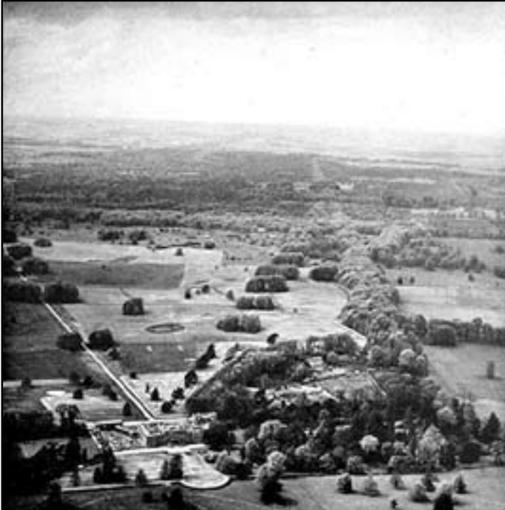
Resim 1. Çiftliğin ilk dönemi

Peki, bu değer bugüne kadar nasıl kullanıldı? Kuruluşundan bugüne geçen 79 yılda Atatürk Orman Çiftliği nasıl değişti? Yeterince korunabildi mi? Kente ve kentliye ne ölçüde kazandırılabilir? Korunmasının önündeki temel sorunlar nedir? Bundan sonra nasıl bir yaklaşımla Çiftlik ele alınabilir? Bu yazıda bu sorular yanıtlanmaya çalışılacaktır.