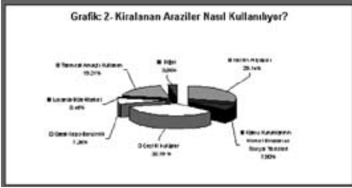
Şekil 2. Kiralanan arazilerin dağılımı