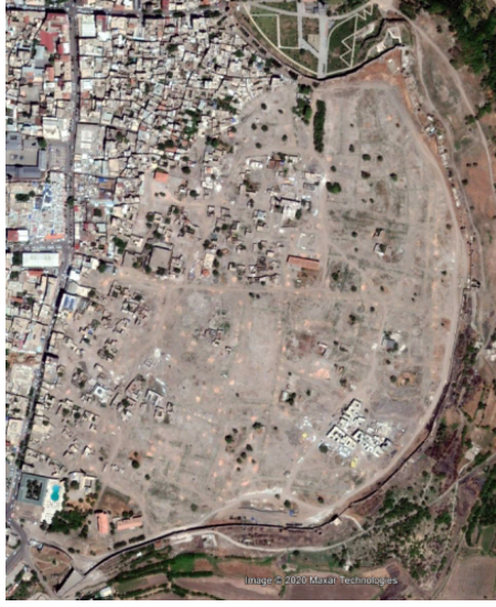
Foto 9: 11.07.2017 tarihli yasaklı 6 mahalle uyu görüntüsü