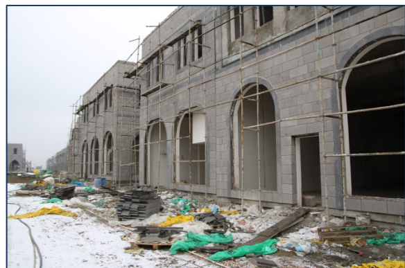
Foto 21 Yenikapı sokak yapılan yapılar ve tescilli yapı cepheleri