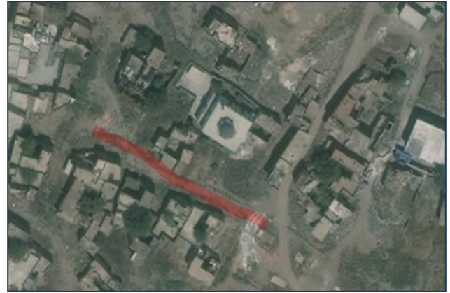
Foto 11: Cemal Yılmaz Mahallesi Şair Sırrı Sokak Mayıs 2016 tarihli fotoğrafı (solda), çatışma sonrası kentsel dönüşüm amaçlı yıkımla sokağın 8 Mart 2020 tarihli uyu görüntüsü (sağda)