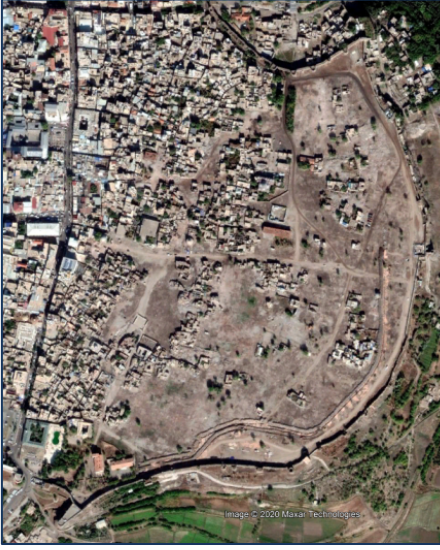
Foto 8: 08.11.2016 tarihli yasaklı 6 mahalle uyu görüntüsü