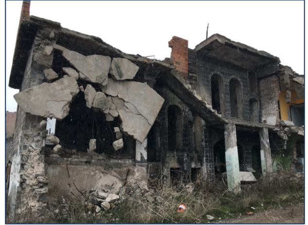
Foto 13: Sokak genişletilmeleriyle dokusu bozulan 673 Ada 98-99 nolu parseldeki tescilli yapıların son durumu