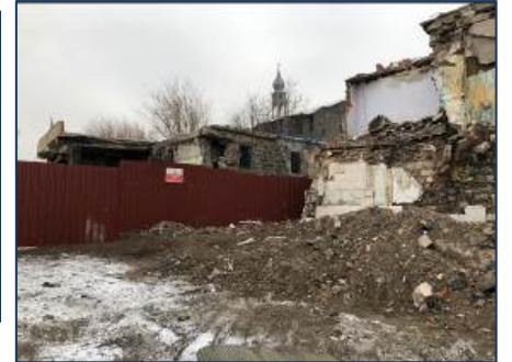
Foto 22 Yenikapı sokağın eski hali ve kentsel dönüşüm sonrası yapılan yapılar ve tescilli yapı cepheleri