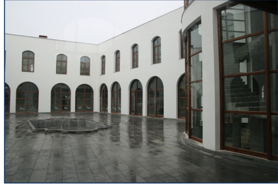
Foto 16: Özgün yapı adası formu değiştirilerek, tevhitte oluşan yeni ticari yapılar