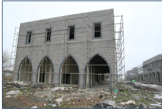
Foto 20 Yeni yapılan yapıların cepheleri