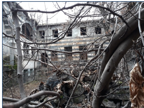
Foto 17: 2016 190 ada 3-16 nolu tescilli parselde yapılan kaçak kazı