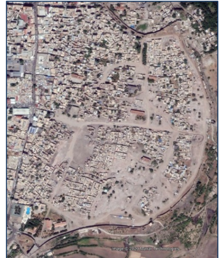
Foto 7: 29.07.2016 tarihli yasaklı 6 mahalle uydu görüntüsü