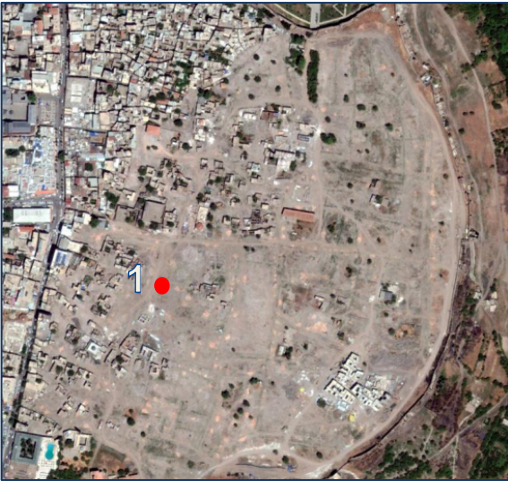
Foto 1: 11.07.2017 tarihli yasaklı 6 mahalle uydu görüntüsü.