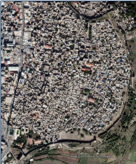
Foto 5: 08.11.2015 tarihli yasaklı 6 mahalle uydu görüntüsü