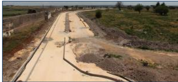
Foto 19: Sur diplerine bırakılan beton bloklar ve yeni yapılan asfalt yol.