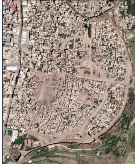
Foto 6: 10.05.2016 tarihli yasaklı 6 mahalle uydu görüntüsü