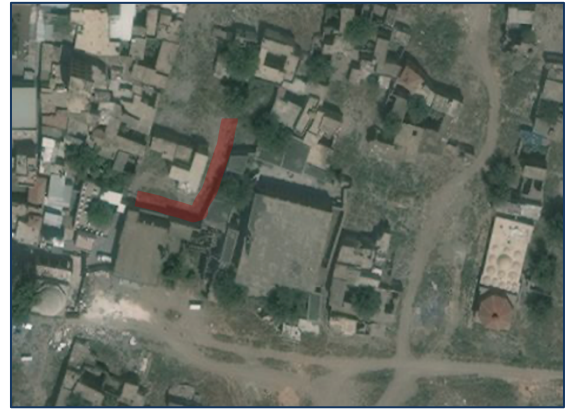
Foto 12: Savaş Mahallesi Şeftali Sokak Haziran 2016 tarihli fotoğrafı (solda), çatışma sonrası kentsel dönüşüm amaçlı yıkımla sokağın 8 Mart 2020 tarihli uyu görüntüsü (sağda)