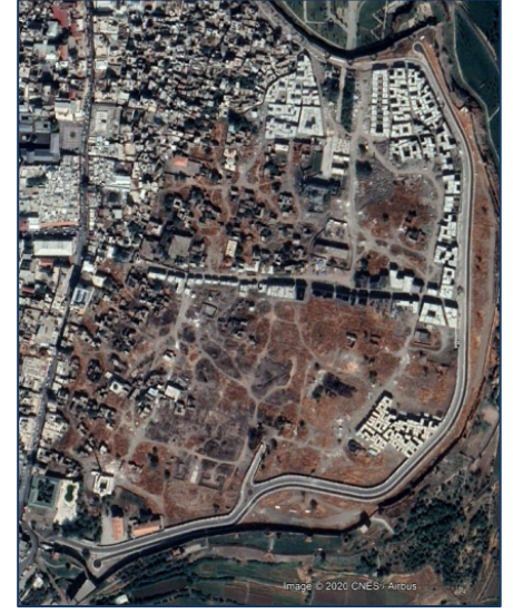
Foto 10: 09.10.2019 tarihli yasaklı 6 mahalle uyu görüntüsü