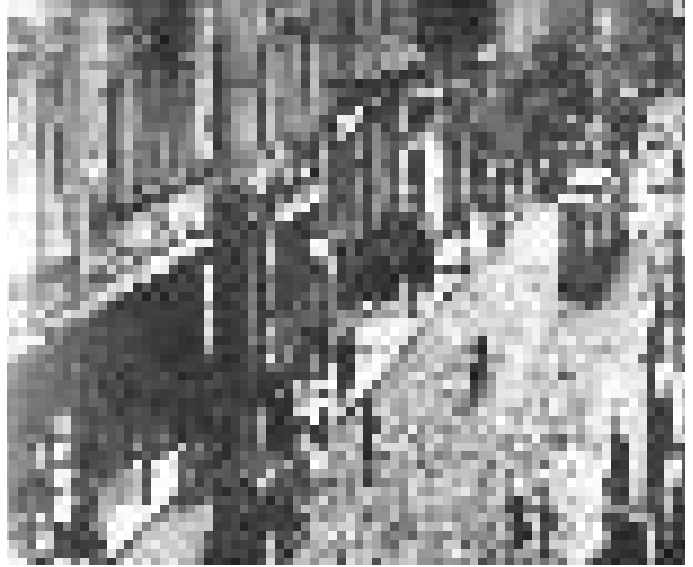
İstanbul İstiklal Caddesi 1930

Küreselleşme olgusunun gelecekte kente yönelik dönüşümlerinin ve seçeneklerinin neler olduğunu tam kestirmemiz mümkün değildir. Ancak küreselleşmenin giderek yaygınlaştırdığı tek tip yaşam düzeni oluşturmaya yönelik siyasi etkileri hem ekonomik, hem de sosyal yaşantımızı olduğu kadar tüm yerleşim birimlerimizi, kentlerimizin kimliklerini ve onları oluşturan kentsel imgeleri de hızla tüketmektedir. Kentte var olan, geçmişle