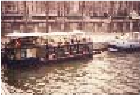
Paris-Seine Nehri 1998