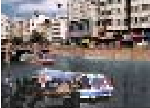
Eskişehir Porsuk Çayı 2004