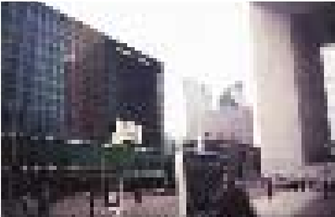
La Defence/Paris 1998

Aydınlanma dönemini tamamlamış sanayileşmiş ekonomik olarak güçlü batı toplumlarının kentleri ile bu süreci halen sürdürmekte ve gelişmekte olan ülkelerin kentlerinin kimlik oluşumlarını ve özelliklerini karşılaştırırken dikkatli olmak gerekmektedir. Belirli ekonomik, sosyal ve kültürel düzeye ulaşmış, dengeli büyümeye sahip gelişmiş batı toplumu kentlerinin sabitlenmiş nüfusları, kentin sahip olduğu doğal, kültürel ve mimari değerleri kolaylıkla benimseyip, ortak değere dönüştürebilmesine olanak tanımaktadır. Bunun yanısıra oluşan kentsel dokuları yabancı ziyaretçilere pazarlamakta ve bundan da büyük ekonomik girdi sağlamaktadırlar. Bu süreçte,