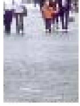
Asfalt baskı döşeme- İstiklal Cd.

ilkeleri ile planlanması, kentsel kimliklerin ve onları oluşturan kentsel imgelerin giderek hızla tahrip edilmesine, içeriklerinin farklılaşmasına, yada içeriksizleşmesine neden olmaktadır. Türk kent sokağından bulvarlara dönüşen sokaklar, tarihi dokular içerisinde yıkılarak oluşturulmaya çalışılan Rönesans meydanları, kültürümüzle hiç bağdaşmayan kent mobilyaları, vb. bu değişim sürecinde kentlerimizde sıkça görmekte olduğumuz örnekler olarak karşımıza çıkmaktadır. Diğer yandan geleneksel doku içerisinde yer kaplaması olarak kullanılan Arnavut kaldırımı olan doğal taş döşeme yerini günümüzde yapay kesme taşlara ve baskı beton/asfalt uygulamalarına bırakmaktadır. Sokak kaplamasındaki öze ait kimlik değişime uğramakta, günümüzde bölgesel ve kültürel olarak değişim göstermeyen tek düze ve her yerde kullanılabilir bir kaplama çeşidine dönüşmektedir.