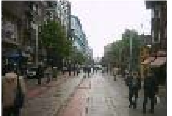
Eskişehir Odunpazarı İki Eylül Caddesi