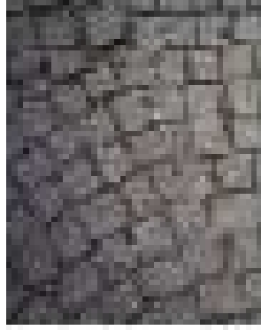
Kesme Taş- Bursa/Muradiye