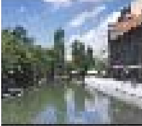
Eskişehir Porsuk Çayı 1985