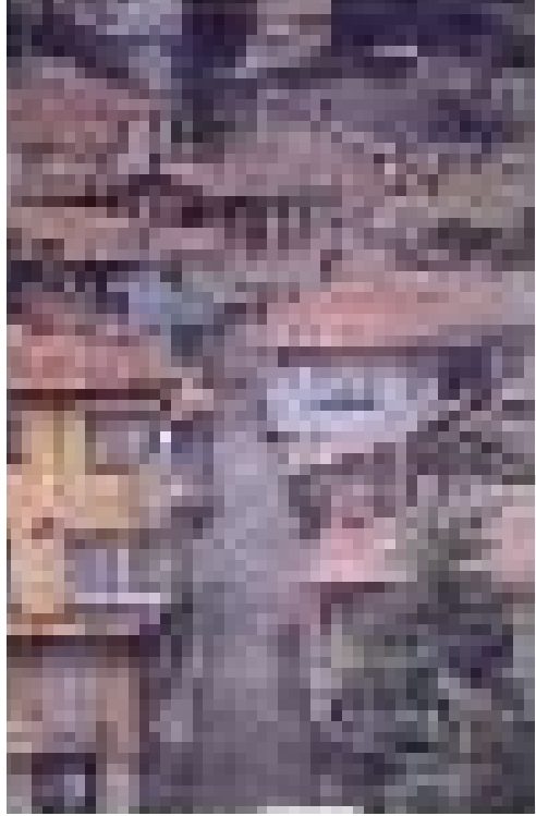
Eskişehir Odunpazarı Beyler Sokak

Küreselleşen dünya ekonomisinde özellikle ayrıcalıklı işletmecilik araçları haline gelen kent yönetimleri ve onların etki alanları olan kentler bir güç ve rant aracı olarak görülmektedir. Kentler son 20 yıl içerisinde birbirleri ile yarışan bir işletme gibi örgütlenmekte, kent işlevi bir işletme olarak verimlilik ve kar sağlamaya dönüşmektedir. Kentlerin bir işletme olarak algılanması ve işletmecilik