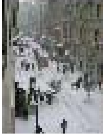
İstanbul İstiklal Caddesi 2003