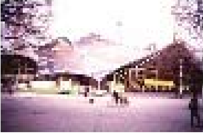
Münih Olimpiyat Stadı 1998

uğruna özveride bulunulabilecek ortak değerlerden oluşturmakta ve kuşaklar arasında söz konusu bu değerler süreklilik göstermektedir.