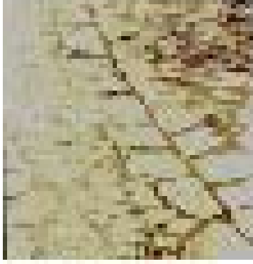
Doğal taş- Safranbolu