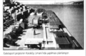
Galataport projesinin Kartal'da Liman'ı ile yapılan planları

Danıştay, Galataport ihalesine yürütmeyi durdurma kararı alırken, TÜPRAŞ'ın yüzde 14.76'lık satışıyla ilgili de soruşturma yolu açıldı. Anayasa Mahkemesi ise ÖİB'e imar planı yapma yetkisi tanıyan yasaya vize verdi