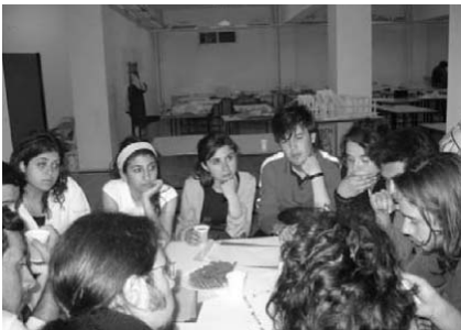
KTÜ Şehir ve Bölge Planlama Bölümü öğrencileri İzmir Buluşmasında çalışma ve sunum yaparken...

3.Ulusal Şehir ve Bölge Planlama Öğrencileri Buluşması'na KTÜ tarafından sınırlı sayıda öğrencinin gönderileceğinin öğrenilmesi üzerine Bölüm Başkanlığı ve öğrencilerle yapılan toplantılarda öğrencilerin tamamının gönderilmesinin