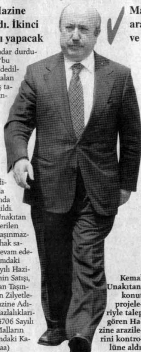
Kemal Unakıtan, konut projeleriyle talep gören Hazine arazilerini kontrolüne aldı.

Maliye Bakanı Kemal Unakıtan imzasıyla valiliklere gönderilen genelgede, Hazine'ye ait taşınmazların özel kanunlara göre hak sahiplerine satış işleminin devam edeceği vurgulandı. Bu kapsamdaki özel kanunlar da, 4070 sayılı Hazine'ye Ait Tarım Arazilerinin Satışı, 4071 sayılı Hazine'ye Kalan Taşınmaz Mallardan Bazılarının Zilyetlerine Devri, 4072 sayılı Hazine Adına Tescil Edilen Miktar Fazlalıklarının İlgilerine Devri ve 4706 Sayılı Hazineye Ait Taşınmaz Malların Değerlendirilmesi Hakkındaki Kanunlar olarak sıralandı. (aa)