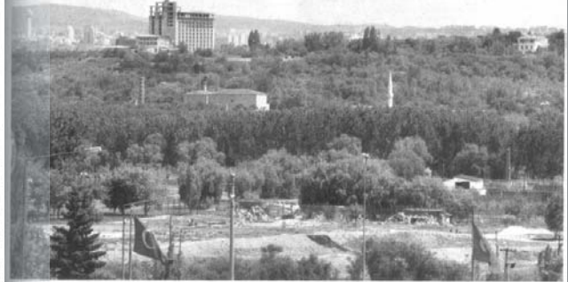
Ahmet KÖPRÜLÜ- Ceyda KARAASLAN

Şehir Plancıları Odası Ankara Şube Başkanı Savaş Zafer Şahin, belediyelerin son 10 yılda farklı ilçelerde yapılan yaklaşık 300 park ve yeşil alanın imar planı değişikliği ile konut, ticaret, cami ve cami altı ticaret alanına dönüştürüldüğünü söyledi