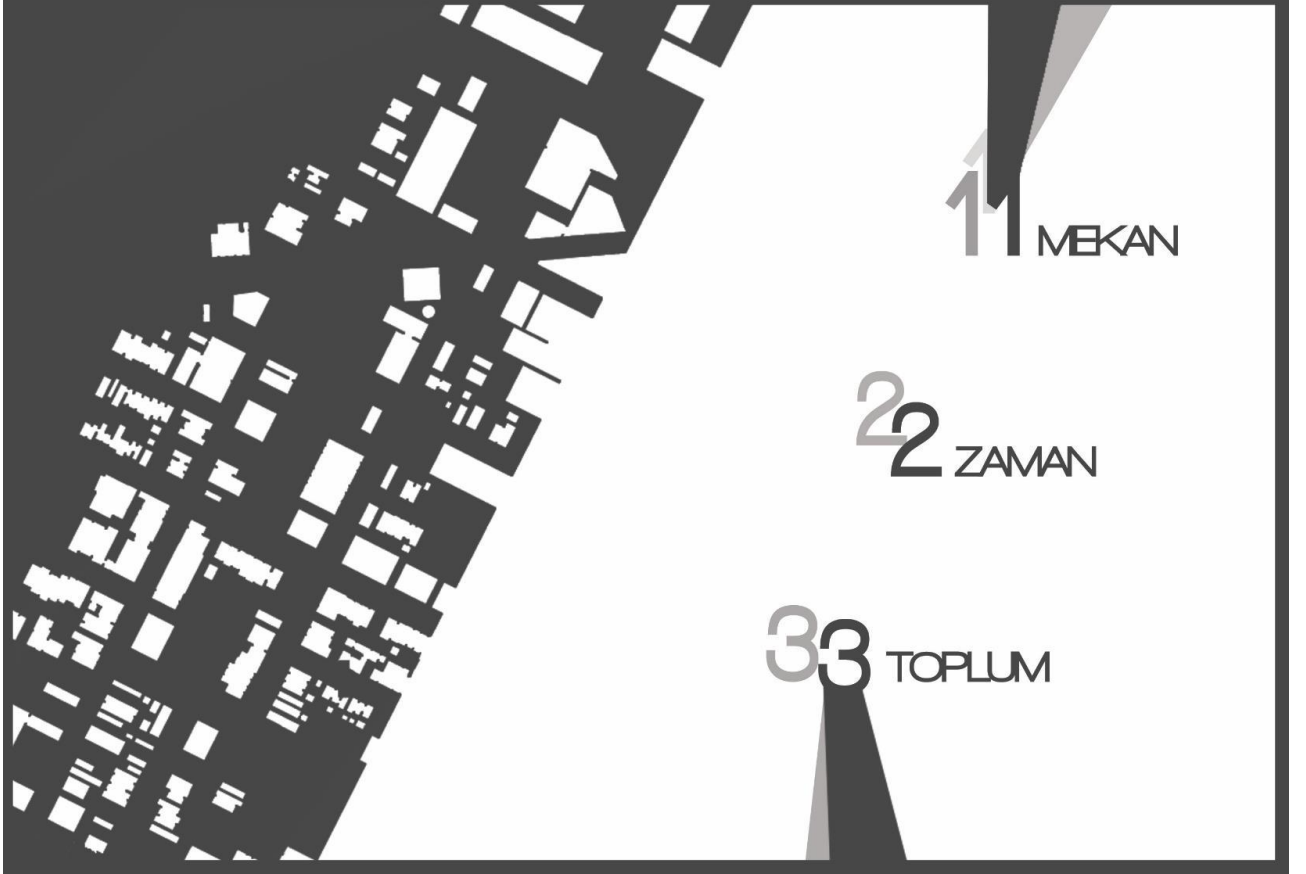
Şekil1: Tarihi ve kültürel mirasın korunmasında ve koruma kriterlerinin belirlenmesinde önemli olan ögeler

Koruma sözcüğünün anlamın TDK Büyük Türkçe sözlüğünde ‘himaye, siyanet ve sakınma’ sözcükleri ile eş anlamlı olarak bulunmaktadır. 1976 yılında UNESCO, Venedik Tüzüğü’nün yeniden tanımladığı anıt kavramını ‘kültürel varlık’ deyimini ile kültürel geleneklerle alakalı olan tüm maddi varlıkları kapsayacak şekilde tanımını genişletmiştir.. ‘Belirli özellikleri sağlayarak bu kategorilere ayrılan korunması gerekli tarihi yerleşimler sit sınırı ile yeterince tanımlı mıdır?’ Sorusu ise bizleri korunacak öge/varlık tespitinden sonra ikinci evreye taşınmaktadır. Bu sorunun yanıtını ararken aslında mekânın nasıl kavramsallaştırıldığını tanımlamak gerekmektedir.